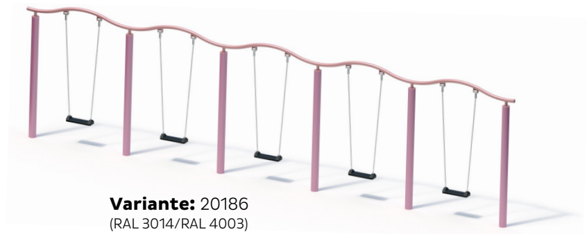
Variante: 20186 (RAL 3014/RAL 4003)