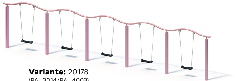
Variante: 20178 (RAL 3014/RAL 4003)

Gewicht: 65 kg schwerstes Einzelteil 351 kg insgesamt