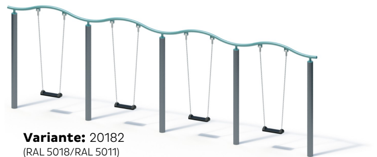
Variante: 20182 (RAL 5018/RAL 5011)